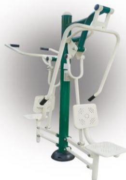
Kombinovaný posilňovač ramien a prsných svalov (deti do 12 rokov s dozorom dospeljej osoby)