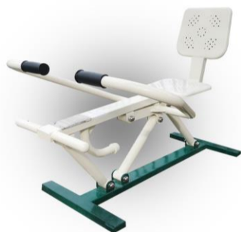
VESLÁ naťahovacie zariadenie