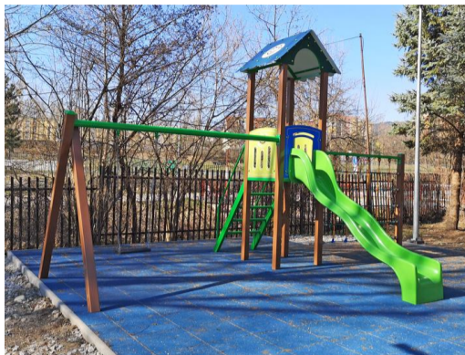
FLORA 62 veža so šmykačkou a hojdačkou